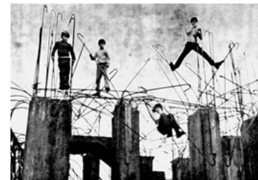
→ Enfants jouant sur les fers à béton d'un chantier abandonné d'une église à Naples en 1972.